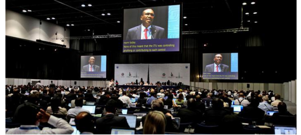
圖 3. 2012 WCIT 杜拜會議

由聯合國附屬單位--國際電信聯盟 (ITU) 所主辦的WCIT年會，過去鮮少受到矚目。然而，今年中、俄等國提案修訂1988年所頒訂的《國際電信規範》，試圖將網路納入管轄，因此，受到全球網路界的高度關注。